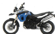
Sondermodell F 800 GS Trophy: Desertblue uni/Alpinweiß uni