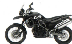
Sondermodell F 800 GS Triple Black: Tiefschwarz uni/Rahmen Granitgrau metallic matt