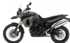
Graphitan metallic matt

Fazit: Ob auf weiten Landstraßen oder mitten im Gelände – die F 800 GS macht überall Freude!